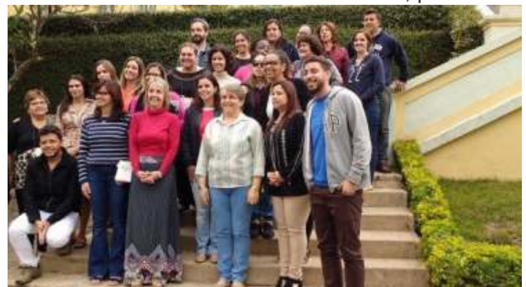
Educadores do Colégio de Juiz de Fora